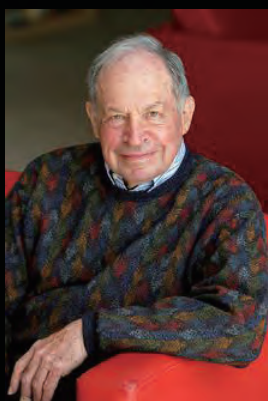
デイビッド・パインズ サンタフェ研究所 「科学と社会の相互作用」

13:00 - 15:35 公開講演：創発宇宙で生きる 15:50 - 17:20 パネルディスカッション：科学研究の楽しみ